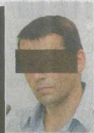
Drogen-Baron Arturs C.